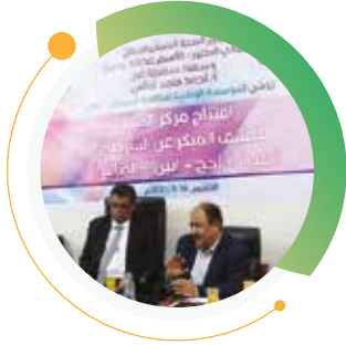
افتتاح مركز الحياة للكشف المبكر عن السرطان عدن