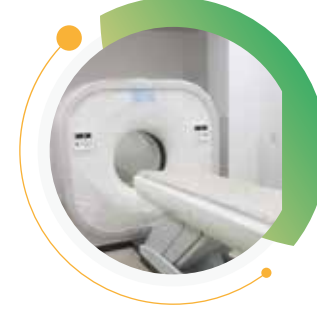
شراء جهاز CT لمركز الأمل - صنعاء