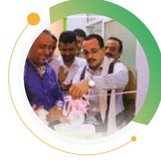
افتتاح مركز الحياة للكشف عن السرطان الحديدة