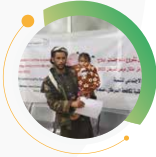
تنفيذ مشروع رنزو لتقديم جلسات الإشعاع كاملة للأطفال إلى سن 18 سنة مجاناً 100٪