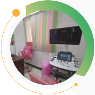
البدء في تجهيز مركز الحياة للكشف المبكر عن السرطان في تعز