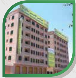
المركز الرئيسي - صنعاء